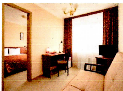
Стандарт 2-х комнатный